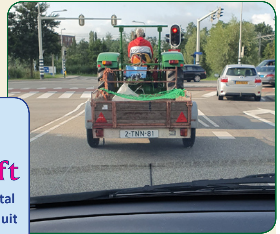
Pieter met traktor op weg naar Concordia