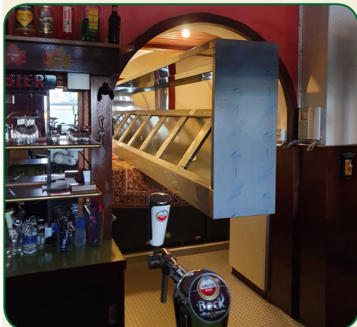
Manoevreren door het luik van de bar