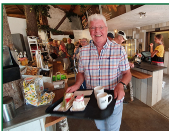
Koffie met gebak

E n de bestemming bleek dit keer ‘t Veluws Zandsculpturenfestijn te zijn. Meer dan honderd prachtige beelden en voorstellingen, helemaal gemaakt van zand, versieren ieder jaar de Beeldentuin in Garderen. Het thema van 2019 is ‘Reis om de wereld’. Iedereen kon op eigen gele-