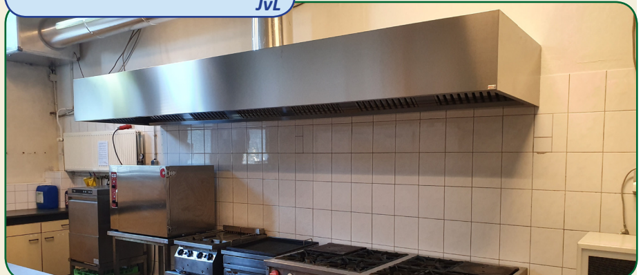
Een resultaat dat gezien mag worden!