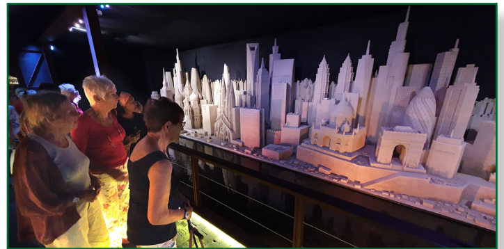
Bewondering voor de kunststukken in zand

genheid rondkijken gesterkt door een kop koffie met gebak. Na deze zanderige reis om de wereld ging de reis wat dichterbij huis verder, maar eerst was er een ruime keus uit belegde broodjes met sapje of melk. Vervolgens ging het op weg naar Assel, gemeente Hoog-Soeren waar diep verscholen in het Veluwe landschap Huifkarcentrum De Kronkel is gevestigd. Daar stonden twee aangespannen huifkarren klaar voor een mooie rit door de bossen. Terug in het centrum was er tijd en ruimte voor een verfrissing en voor een toe-