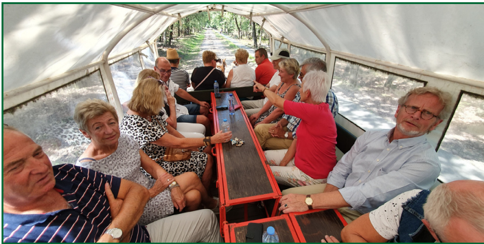
....kijken naar de kont van het paard.....

De jaarlijkse “verwendag” voor de vrijwilligers van Concordia viel dit keer op zaterdag 31 augustus. De letterlijk zonnige dag begon met koffie en stroopwafels in de sociëteit, waarna het gezelschap van bijna 50 leden al dan niet met “aanhang” aan boord ging van de bus. De chauffeur was met de vijfde keer dat hij dit gezelschap vervoerde een oude bekende geworden en met groot vakmanschap laveerde hij de lange bus door Gouda richting het oosten. Zoals gebruikelijk was het einddoel van de reis pas bekend bij het bereiken ervan.