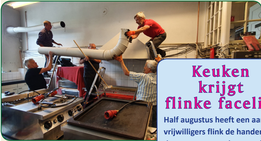
De afvoerpijp wordt afgevoerd