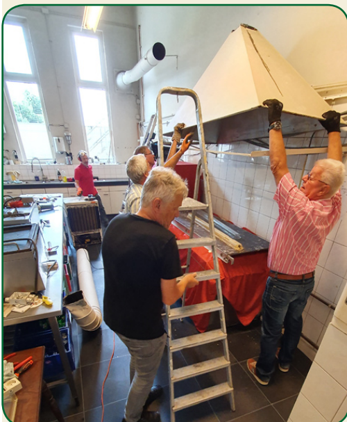
En daar gaat de oude afzuigkap