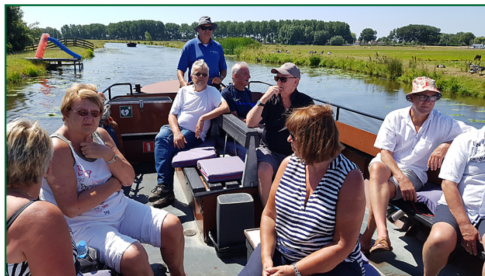
Op het achterschip

>>>>>>>>>>>>>>>>>>>>>>>>>>>>>>>>>>>>>>>>>>>>