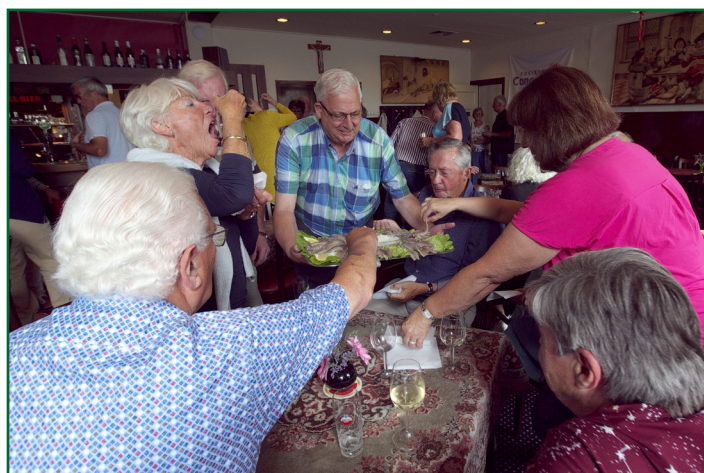
De maatjes gingen vlot van de hand