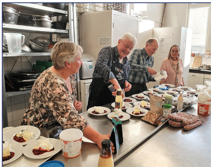
De brigade in volle actie

geitenkaas en walnoten. Een verrassend lekker binnenkomertje. Het daarop volgende hoofdgerecht bestond uit een prima stukje kip met