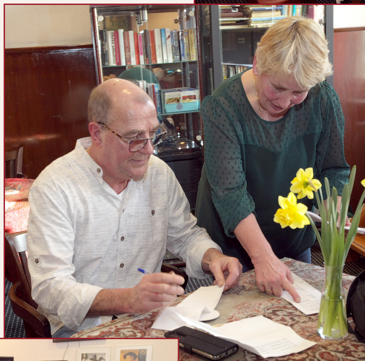
Testen is een serieuze zaak

Alles was in gereedheid gebracht: het water om de glazen te spoelen, de spittonen om de geproefde wijn in uit te spuwen en het onmisbare stokbrood om een neutrale smaak te creëren tussen het proeven van twee verschillende wijnen. Opgemerkt moet wel worden dat na alle keuringen de spittonen opvallend weinig wijn bevat-