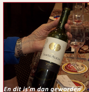
En dit is'm dan geworden

Vervolgens komen de commentaren los. Cijfers worden vergeven voor kleur, geur en smaak, maar de eerste wijn scoort niet hoog.