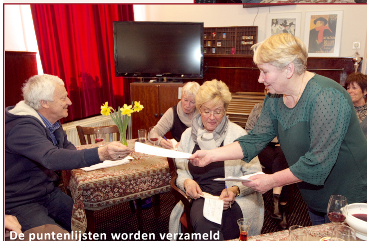
De puntenlijsten worden verzameld

glas gestoken gevolgd door die met spanning gevulde eerste slok. Dan klinkt het gorgelende geluid van lucht dat tussen tong en gehemelte wordt doorgelaten om zo de aroma's zo goed mogelijk te laten loskomen.