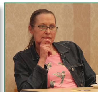
Verder op pagina 3 >>