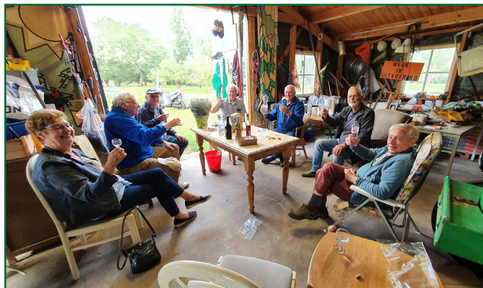
Toost op een gezellige visdag

Dit was ook het moment van de sterke verhalen en er zouden nog even wel wat